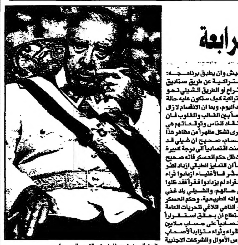
الجنرال بينوشيه (يمين، ارييف، القدس العربي)